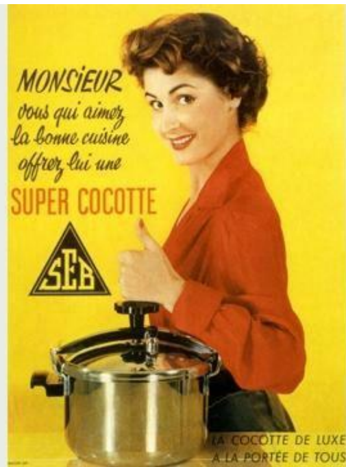
Affiche pour une publicité SEB, France, 1950