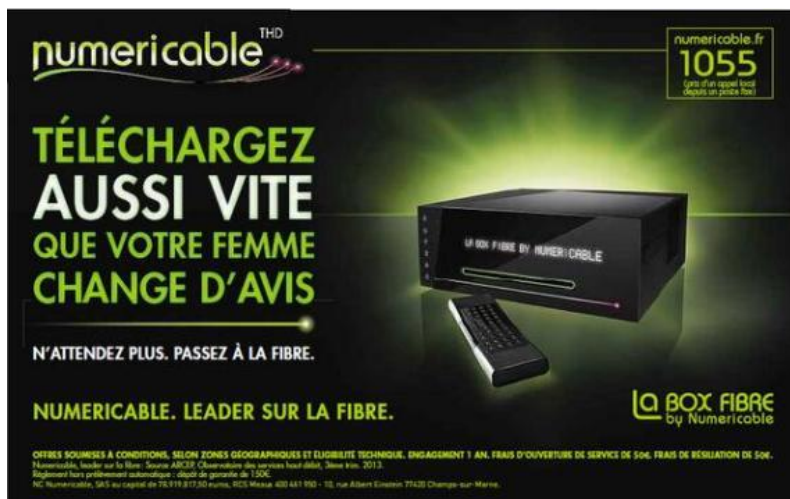
Affiche de publicité pour Numéricâble le 6 janvier 2014.